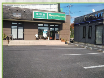
ドミノピザさんの向かい、緑色の看板が目印です

「お電話ありがとうございます! モント・レゾンです」と出ますので、「チラシを見て予約したいのですが」とお伝えください